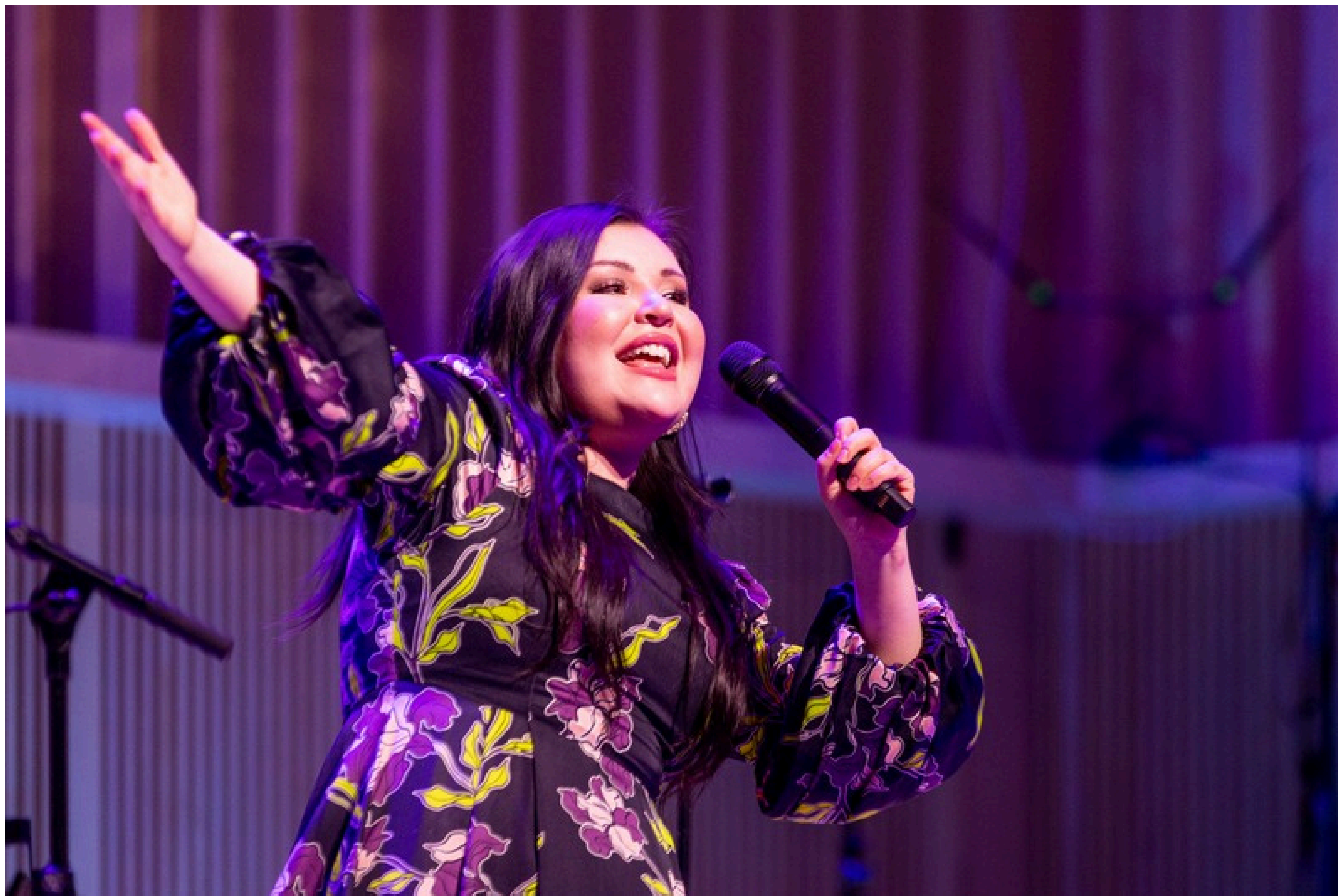
Juhlimme yhdessä työntekijöidemme, vapaaehtoisiemme ja yhteistyökumppaneidemme kanssa Ilta ystävyydelle -konsertissa 14.2.2025. Tampere-talo oli valaistu upeasti ystävänpäivän kunniaksi TampereMission tunnusvärillä pinkiksi.